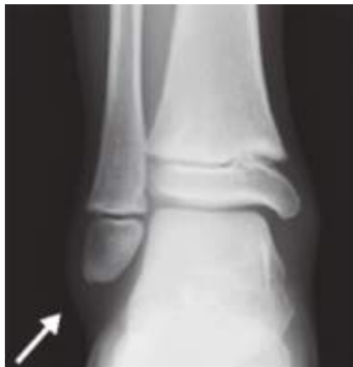
裂離骨片 (X 線像)

足関節単純 X 線で正面、側面像と内旋斜位像や軸位撮影などで骨折や足関節外果の骨端線損傷や裂離骨片があるか確認する。超音波エコーにても確認ができる。