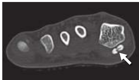
CT 種子骨骨折 16才 男性