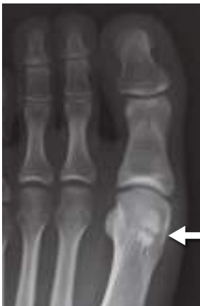
X線像 有症状の二分種子骨 24才 女性

母趾MTP関節底側の腫脹と胼胝や圧痛の有無を診察し、母趾の伸展で疼痛が増強することを確認する。スポーツなどの原因の問診を行う。足全体の外反母趾・内反母趾・凹足などの変形と神経症状も確認する。X線で3方向(正面、側面、軸位)を撮影し、必要に応じて斜位像も撮影する。種子骨の骨折、分節化、不正像などを認めることがある。二分種子骨や分裂種子骨があっても必ずしも有症状とは限らない。CTやMRIも骨折や骨壊死などの病態の描出には有効である。骨シンチグラフィが行われることもある。