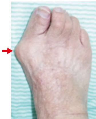
外反母趾の例 第2趾、第3趾はハンマー趾変形を生じている。矢印はバニオン

外反母趾の症状は多彩である。第1中足骨頭内側の軟部組織あるいは骨性の隆起はバニオンと呼ばれる。バニオンが履物にあたって痛みを生じるほか、中足骨頭底側の有痛性胼胝や、外反した母趾に圧迫されて第2趾や第3趾が変形（ハンマー趾変形）し、痛みを生じることもある。