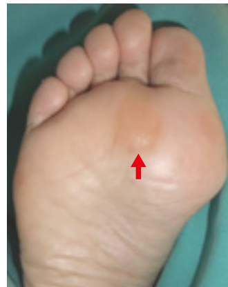
外反母趾に伴う中足骨頭底側の胼胝（矢印）