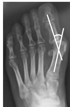
外反母趾の単純X線像 本症例の外反母趾角は30°