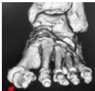
外反母趾例の3次元CT像 母趾基節骨は外反し回内している（矢印）

外反母趾の特徴として、第1中足骨内反によるバニオン、母趾の外反・回内変形などが挙げられる。母趾基節骨は周囲の筋や支持組織によりその位置のバランスを保っているが、第1中足骨が内反すると、短母趾屈筋、母趾外転筋、母趾内転筋などの筋群や、足底腱膜、種子骨などが相対的に外側に移動する。これが母趾基節骨の外反・回内変形を助長する（増悪させる）。