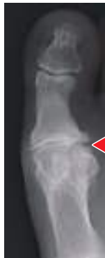
X線像 関節裂隙の消失

母趾MTP関節は、最大伸展位で骨頭にストレスがかかる。さらに負荷がかかると軟骨が変性し、進行すると中足骨骨頭背側、基節骨背側に骨棘が出現し可動域制限が生じる。重度になると関節裂隙が消失し、さらに強い疼痛と可動域制限を認める。