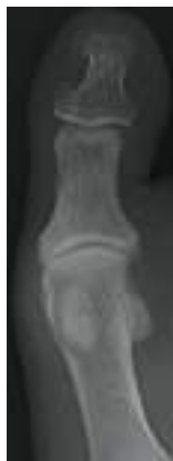
荷重位 正面 軽度

その他の母趾MTP関節の痛みには、外反母趾や痛風による関節炎、関節リウマチがあるので、鑑別診断が重要である。