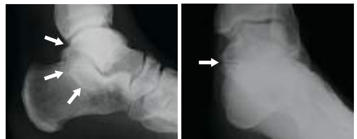
足関節側面像 C-sign(白矢印)