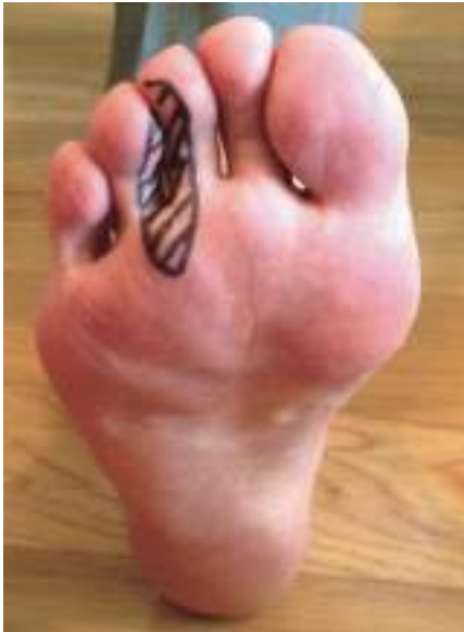
趾間の知覚異常の部位