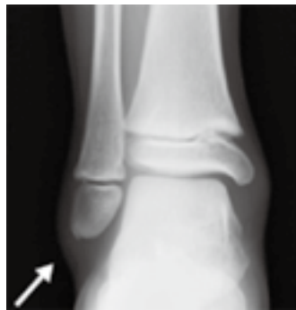
裂離骨片 (X 線像)

足関節単純 X 線で正面、側面像と内旋斜位像や軸位撮影などで骨折や足関節外果の骨端線損傷や裂離骨片があるか確認する。超音波エコーにて確認ができます。